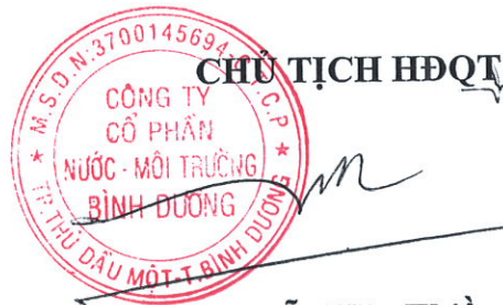
Nguyễn Văn Thiên

Cuộc họp kết thúc vào lúc 14 giờ 00 phút cùng ngày, các thành viên dự họp đã đọc và thống nhất ký vào Biên bản này.